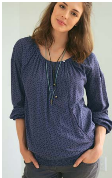
D. Blouse smockée 34€ 95 | prix club 29€ 95