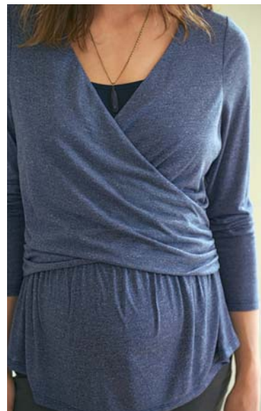
E. T-shirt cache-cœur 24€ 95 | prix club 20€ 95