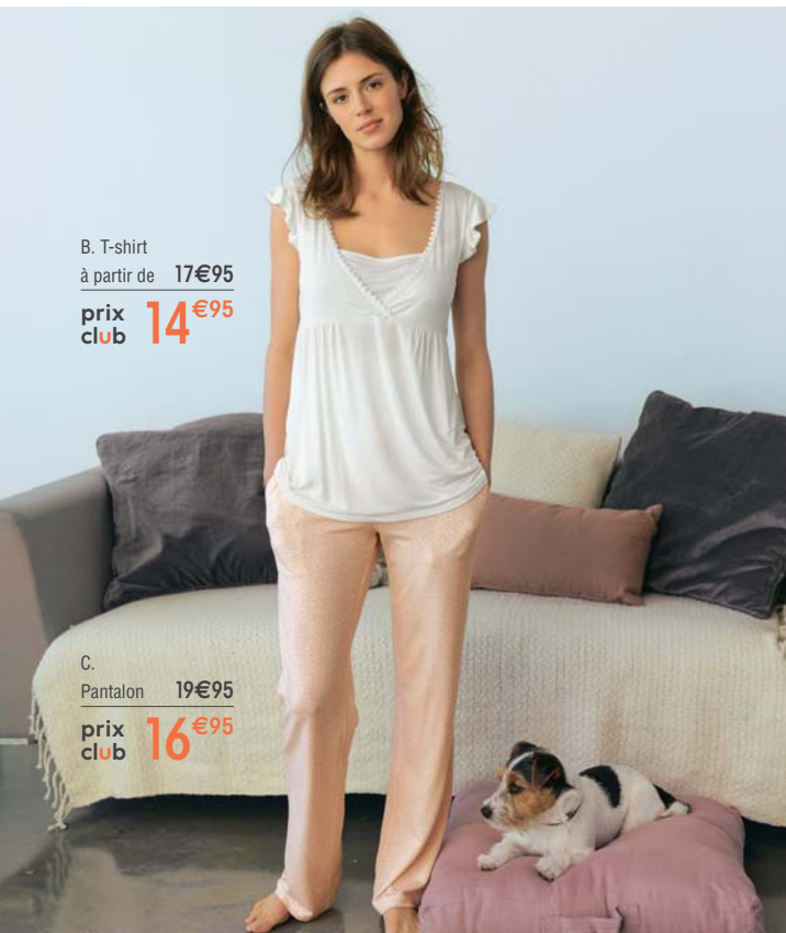
B. T-shirt à partir de 17€95 prix club 14€95