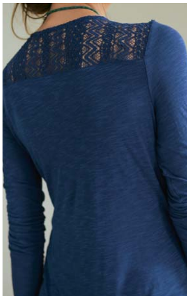
A. T-shirt dentelle 23€ 95 | prix club 19€ 95

F. T-shirt Tunisien 24€ 95 prix club 20€ 95